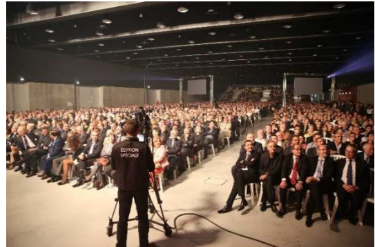
© Grand Nancy Congrès & Évènements